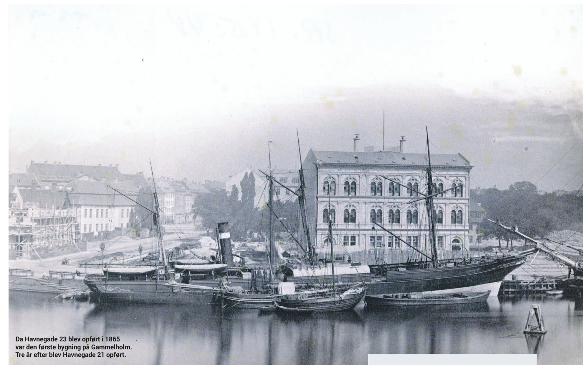
Da Havnegade 23 blev opført i 1865 var den første bygning på Gammelholm. Tre år efter blev Havnegade 21 opført.